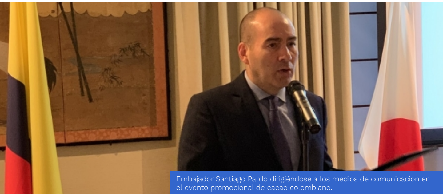
Embajador Santiago Pardo dirigiéndose a los medios de comunicación en el evento promocional de cacao colombiano.

La Embajada de Colombia en Japón y ProColombia, en el marco de la estrategia CO-nectados y en colaboración con una reconocida marca japonesa de chocolates elaborados con cacao 100% colombiano, realizaron un evento con aproximadamente 40 representantes de medios de comunicación y relaciones públicas, con el propósito de difundir los atributos del cacao colombiano y promocionar su consumo en la próxima temporada de San Valentín.