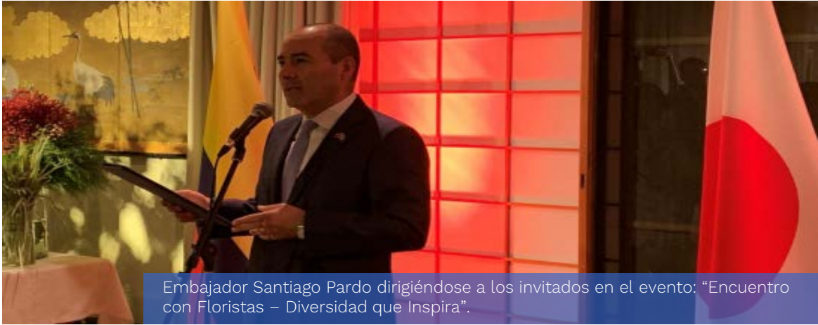
Embajador Santiago Pardo dirigiéndose a los invitados en el evento: “Encuentro con Floristas – Diversidad que Inspira”.

Tokio (nov. 11-12/19). El Embajador Santiago Pardo acompañó la agenda de trabajo desarrollada por Flavia Santoro, Presidente de ProColombia, en su visita a Japón con la cual se fortalecieron los lazos con el sector empresarial y con el gobierno nipón. En tan solo día y medio de estadía en Tokio, la agenda cubrió los tres ejes de promoción de ProColombia: Inversión, Exportación y Turismo e incluyó ocho encuentros con empresarios y la participación en un evento promocional de flores organizado por Asocolflores.