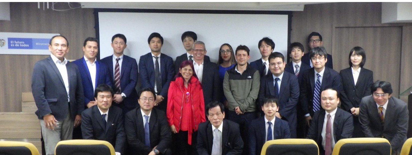
Representantes de la delegación japonesa en compañía de funcionarios del gobierno colombiano del sector minero energético y ambiental.

Una misión japonesa público-privada, liderada por la Corporación Nacional de Petróleo, Gas y Metales de Japón (JOGMEC, por sus siglas en inglés), sostuvo un encuentro en Bogotá con representantes del Ministerio de Minas y Energía y de las entidades del sector, con el propósito de conocer de primera mano la situación actual del sector metales en Colombia, específicamente oro y cobre, la normatividad, potencial y oportunidades de negocios e inversión.