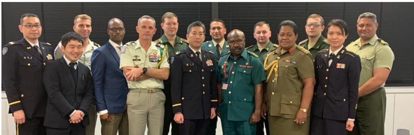
Grupo de participantes del curso de entrenamiento TRES (Tomodachi Rescue Exercise).

En el marco del Memorando de Entendimiento de Defensa entre el Ministerio de Defensa Nacional y el Ministerio de Defensa de Japón, Colombia participó en el curso de atención de Desastres y Asistencia Humanitaria Tomodachi Rescue Exercise, entre el 19 y el 22 de febrero, en varias ciudades del Japón.