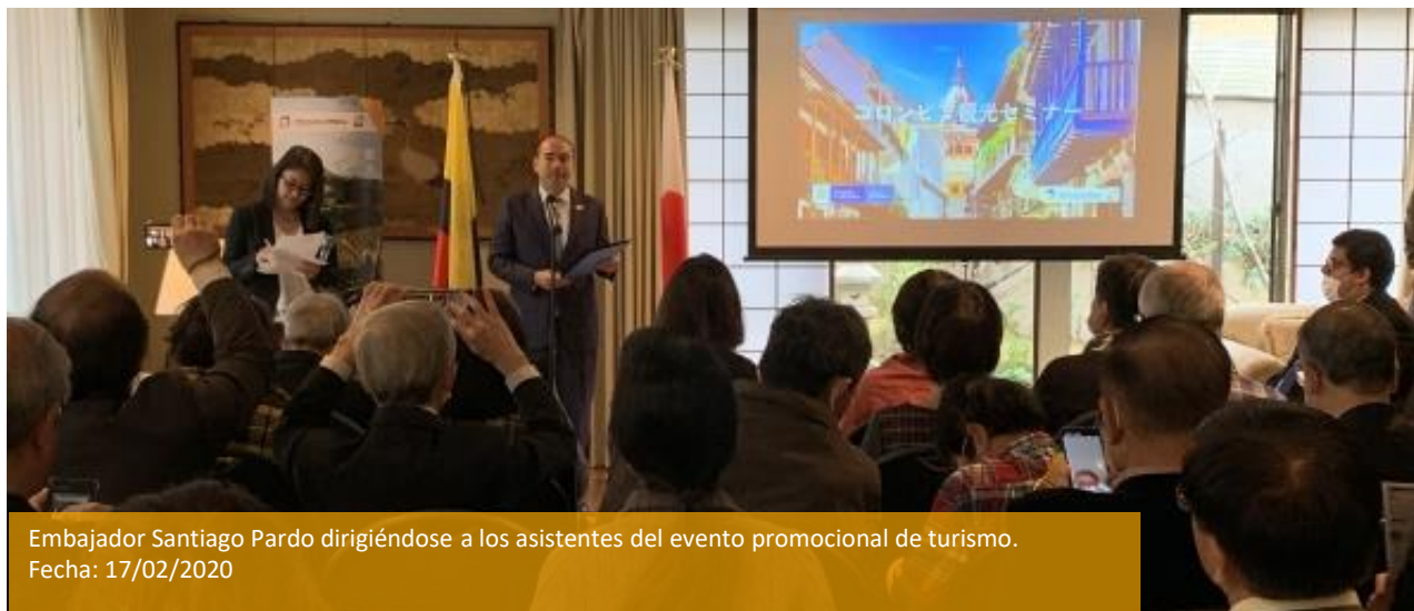
Embajador Santiago Pardo dirigiéndose a los asistentes del evento promocional de turismo. Fecha: 17/02/2020

El embajador Santiago Pardo presidió el evento de promoción turística ante un grupo de viajeros japoneses con el fin de presentarles a Colombia como nuevo destino turístico de alto nivel. La actividad promocional se realizó en el marco de la estrategia CO-nectados del gobierno colombiano en coordinación con ProColombia e importantes aliados japoneses del sector turismo. El embajador Pardo resaltó la riqueza y variedad turística del país, desde su historia, cultura, gastronomía, patrimonios de la humanidad Unesco, naturaleza y la calidez y hospitalidad de los colombianos.