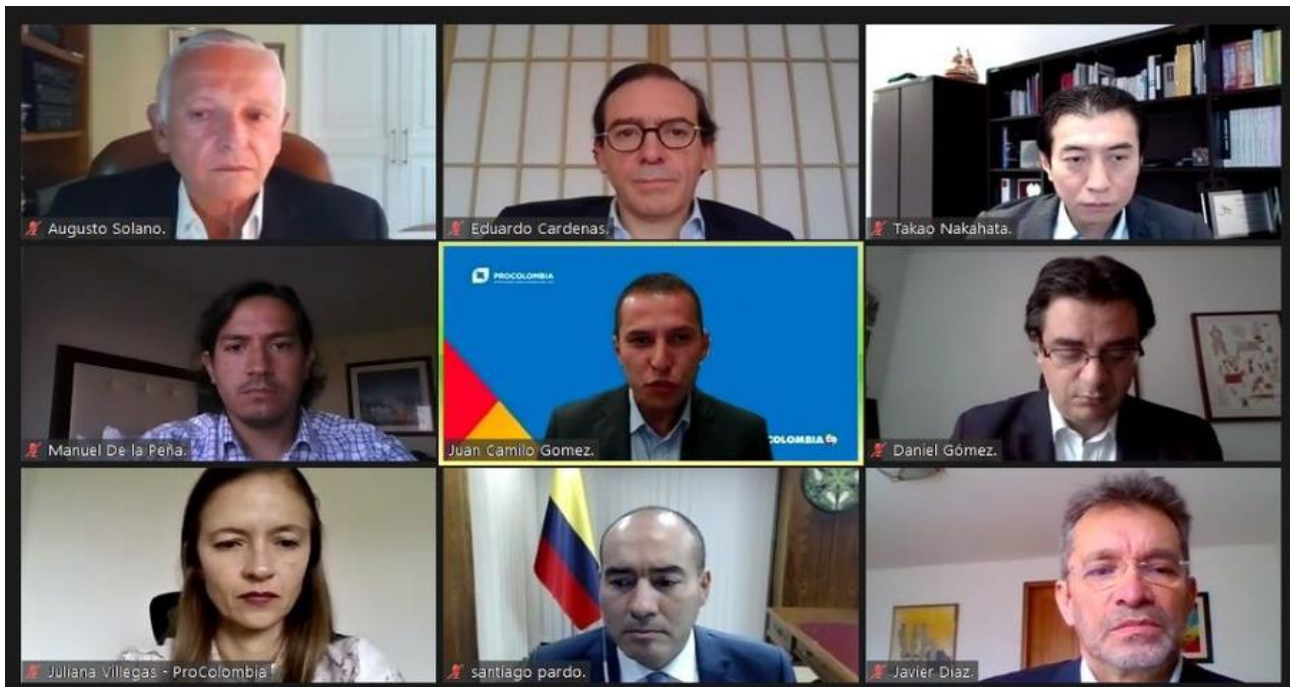
Captura de pantalla del evento

AnalDEX, ProColombia y la Embajada de Colombia en Japón unieron esfuerzos para promocionar las oportunidades comerciales que ofrece el mercado japonés a través del Foro "Japón: Nuevos Horizontes", evento que se realizó el miércoles 26 de mayo a las 8 a.m. hora Colombia.