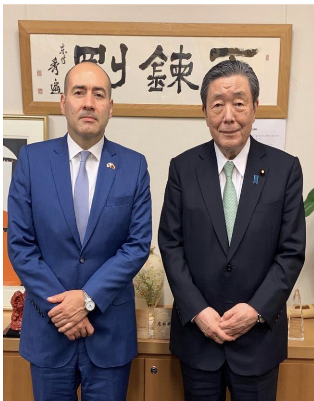
Embajador Santiago Pardo y parlamentario y exministro de Agricultura, MORIYAMA Hiroshi

En el encuentro con el parlamentario Moriyama se dialogó, entre otros temas, sobre el acuerdo de asociación económica en negociación y el potencial para robustecer el relacionamiento en materia agropecuaria entre ambos países.