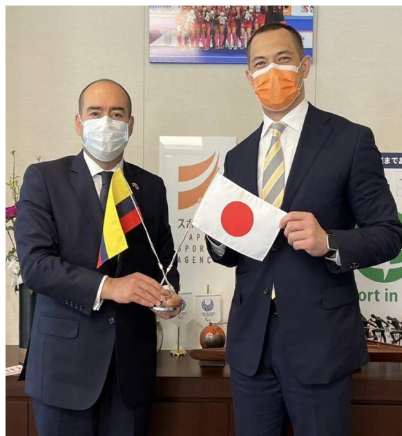
Embajador Santiago Pardo y el Comisionado de la agencia de Deportes de Japón MUROFUSHI Koji

Además de discutir sobre los avances frente a la participación de Colombia en Tokio 2020, así como en diferentes proyectos relacionados con los Juegos, durante la reuniones se reiteró la intención de dinamizar las interacciones entre el Ministerio del Deporte y la Agencia Deportiva del Japón para ejecutar acciones concretas a través de un instrumento de cooperación bilateral.