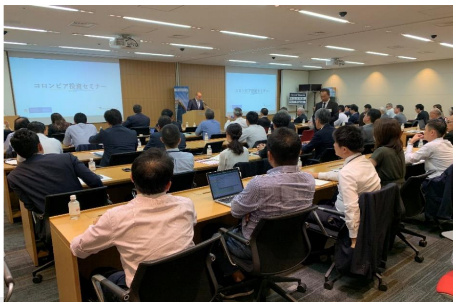
Izq. Intervención del Embajador Santiago Pardo Salguero – Der. Participantes en Seminario de Oportunidades de Inversión en Colombia

Tokio (oct. 3/19). La Embajada de Colombia y Procolombia, en el marco de la estrategia CO-nectados, en alianza con la agencia de promoción de Japón -JETRO-, el Banco Interamericano de Desarrollo y la firma Baker & McKenzie, y con la colaboración con SoftBank Corp., realizaron un seminario en Tokio sobre beneficios y oportunidades que ofrece Colombia para la promoción de la inversión extranjera en nuestro país.