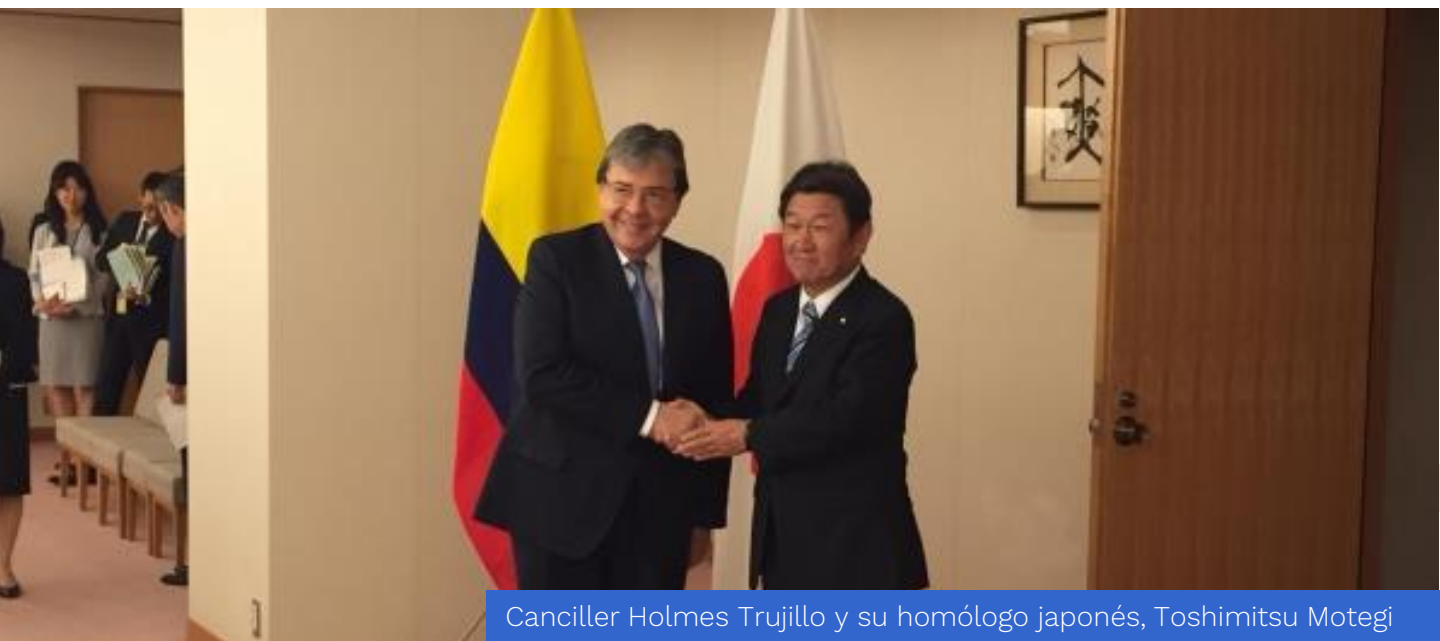
Canciller Holmes Trujillo y su homólogo japonés, Toshimitsu Motegi

Tokio (oct. 21/19). El Ministro de Relaciones Exteriores, Carlos Holmes Trujillo, ratificó la voluntad del gobierno colombiano de impulsar las negociaciones del Acuerdo de Asociación Económica entre Colombia y Japón así como el interés en profundizar la relación bilateral a través del comercio, la inversión y el intercambio en diferentes áreas. El Canciller japonés reiteró adicionalmente su apoyo a Colombia en sus gestiones ante la crisis migratoria en Venezuela. Ambos Cancilleres destacaron la celebración de 110 años de relaciones diplomáticas el año pasado y 90 años de la migración japonesa a Colombia, este año.