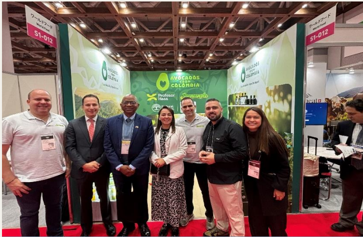
Embajador Makanaky en compañía de Presidenta Ejecutiva de CORPOHASS y empresarios del sector