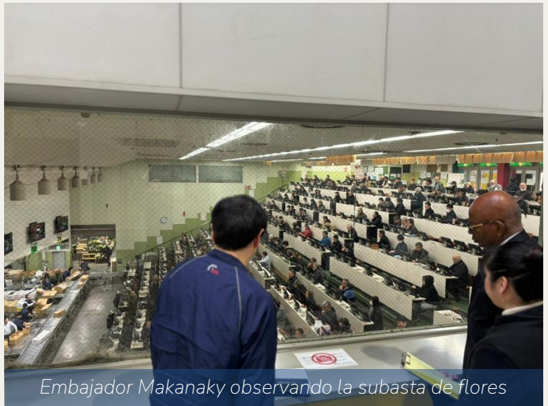
Embajador Makanaky observando la subasta de flores

13 de marzo → El Embajador Makanaky visitó el principal mercado de flores de Japón con el fin de explorar sinergias con la subasta para promocionar las flores colombianas.