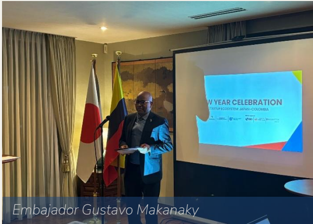
Embajador Gustavo Makanaky