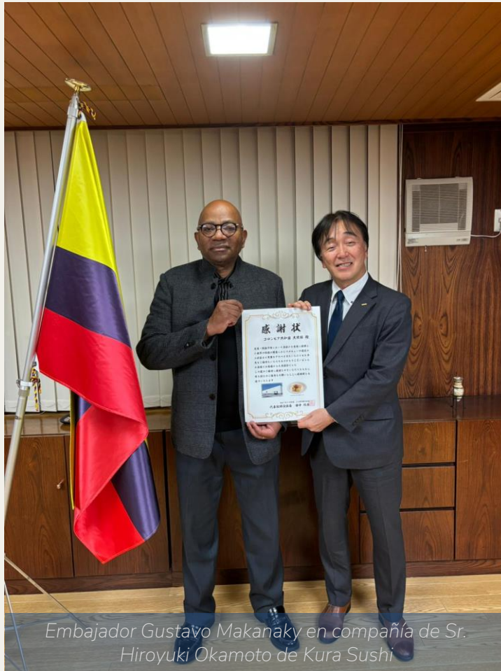
Embajador Gustavo Makanaky en compañía de Sr. Hiroyuki Okamoto de Kura Sushi

19 de enero → El Embajador Makanaky recibió un diploma de agradecimiento otorgado por el presidente de la importante cadena de restaurantes Kura Sushi, en retribución a la colaboración prestada en el proyecto hands-hands que presentó platos de Colombia y el mundo durante la OSAKA-EXPO 2025.