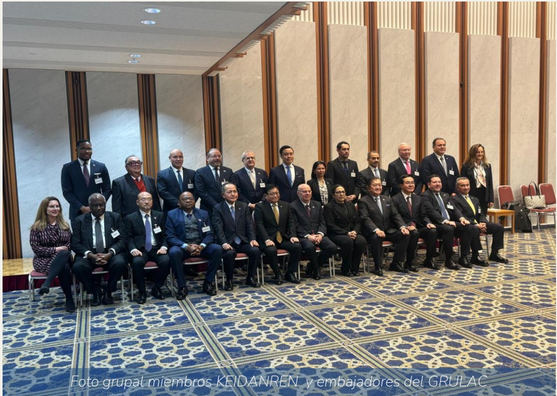
Foto grupal miembros KEIDANREN y embajadores del GRULAC