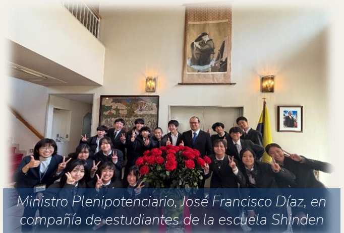
Ministro Plenipotenciario, José Francisco Díaz, en compañía de estudiantes de la escuela Shinden

Al cierre de la visita, los participantes manifestaron un profundo interés por los temas expuestos, y muchos de ellos expresaron su firme deseo de visitar Colombia en el futuro.