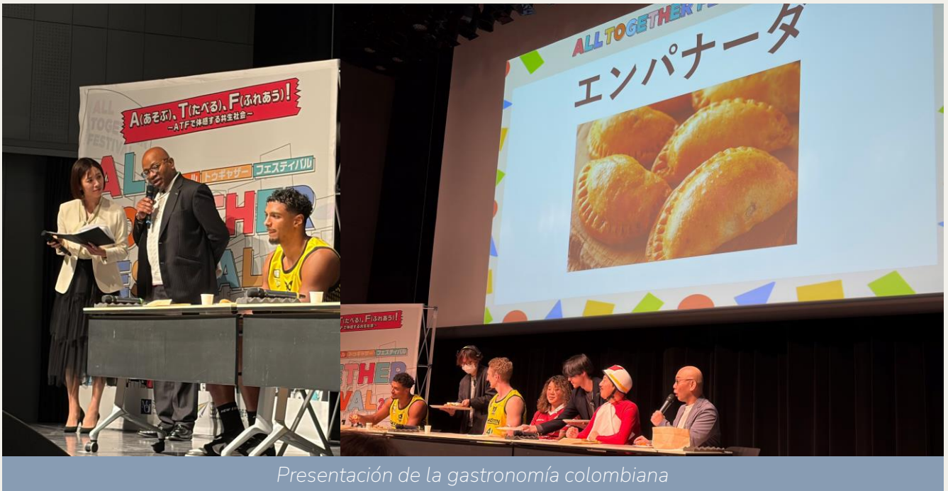
Presentación de la gastronomía colombiana

18 de enero → El Embajador Gustavo Makanaky participó en el All Together Festival, un espacio diseñado para promover la convivencia y el diálogo intercultural.