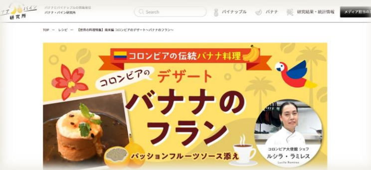
Patacón, flan de banano y artículos sobre la cultura culinaria colombiana

23 de febrero → La Embajada de Colombia en Japón promovió la gastronomía y la cultura colombiana en Japón a través de una entrevista con el medio digital japonés Banana & Pineapple Research Institute, resaltando el valor cultural y gastronómico del plátano y el banano en Colombia, su historia y su estrecho vínculo con la literatura de Gabriel García Márquez.