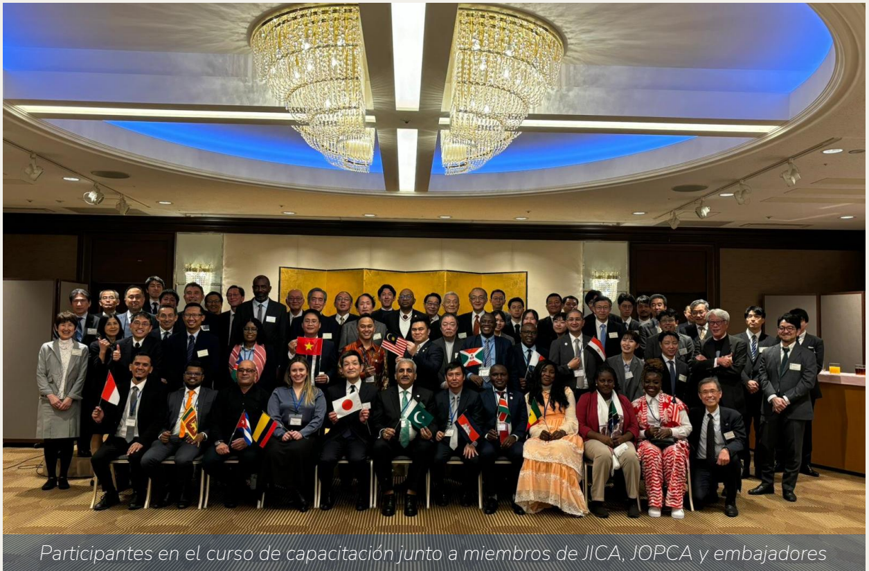
Participantes en el curso de capacitación junto a miembros de JICA, JOPCA y embajadores

18 de febrero → El Embajador Makanaky acompañó a la Dra. Lorena Rios, delegada y aprendiz del Ministerio de Transporte, en la apertura del curso de capacitación de JICA (Japan International Cooperation Agency) sobre administración y gestión portuaria estratégica, evento en el cual el embajador se reunió con importantes actores del sector portuario en busca de oportunidades de cooperación e inversión.